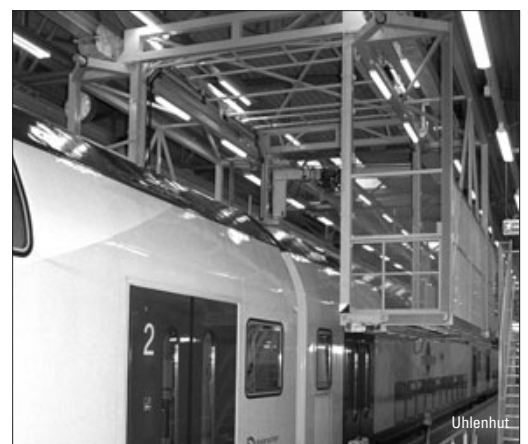
Die Wartung des Metronom – ab Seite 44