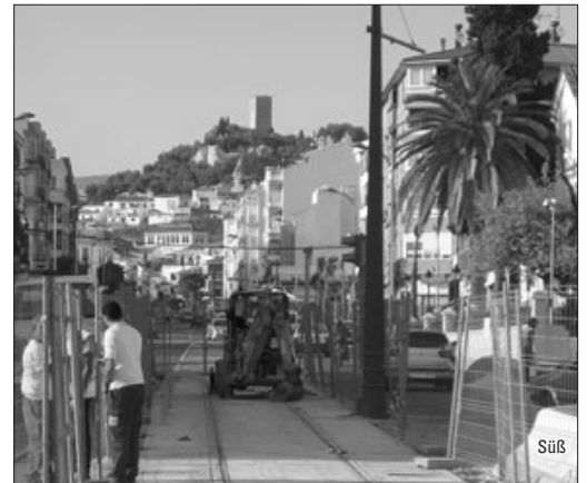
Neue Straßenbahn Vélez-Málaga – ab Seite 6