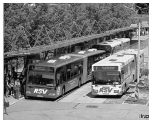
Stadtverkehr Reutlingen, ab Seite 30