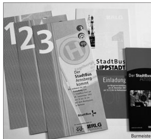
„Revitalisierung“ von Stadtbusverkehren, ab Seite 6