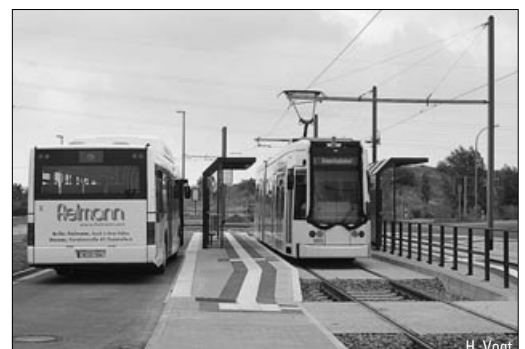
Neue Stadtbahnlinie U2 in Stuttgart eröffnet, ab Seite 18